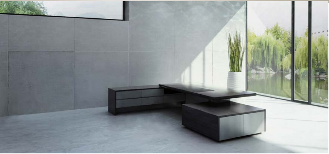
D8国产版高级行政班台