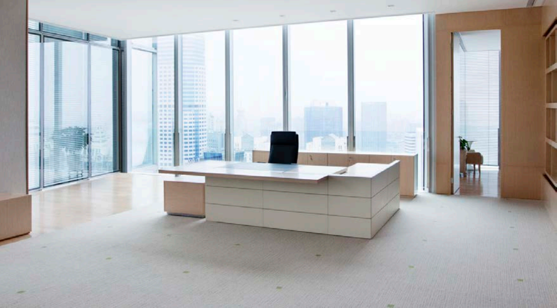
D8豪华款高级行政班台