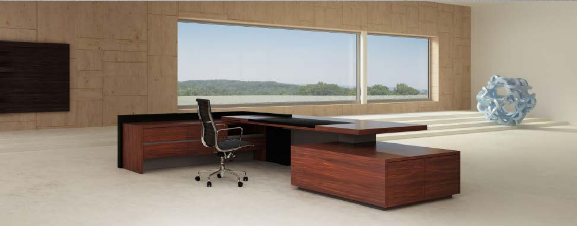
D8限量版高级行政班台